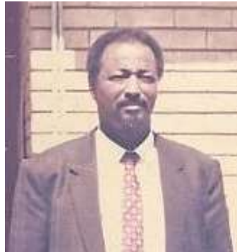
Danjire Ciise Cali Max'ed Ciise dheere