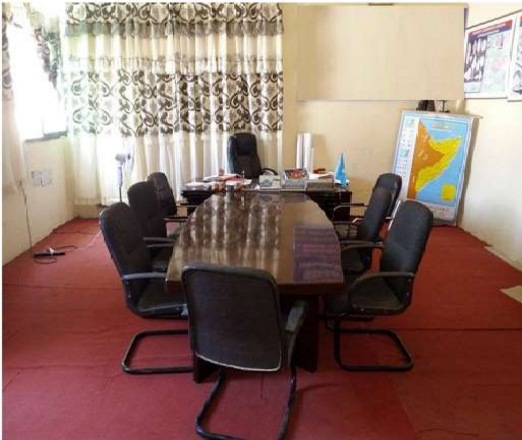
Howlka shirarka mas'uuliyiinta sare ee Hey'adda