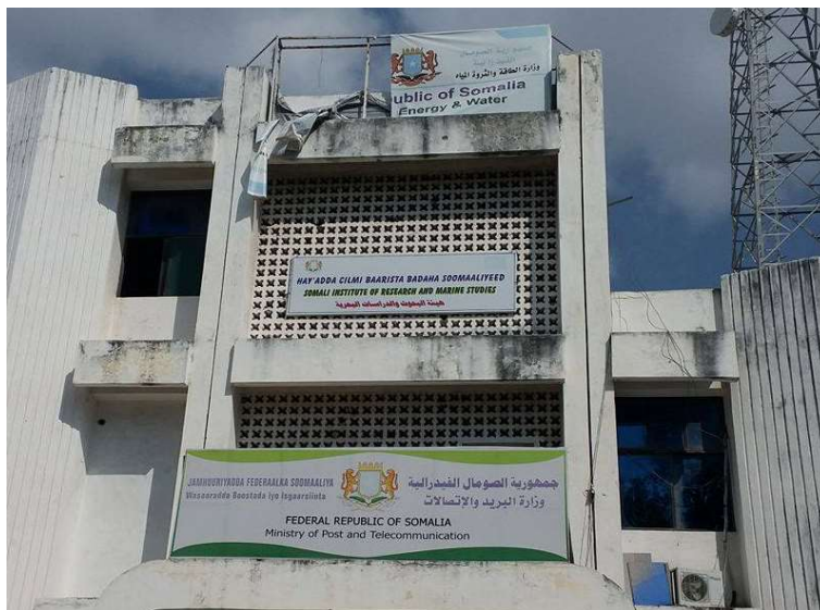
Dhismaha Wasaarada Boostada oo ay Hey'addu hadda degan tahay.

Waxaanna mahad u jeedineynaa wasiirka, wasiir ku xigeenka, agaasimaha guud iyo mas'uuliyiinta kale oo noo fidiyey gacantaas. Waana kan sawirkii dhismaha Wasaaradda Boostada waxaad ka arki kartaa boorka (Looxa) hey'adda CBS oo u dhaxeeya labada boor oo kala ah kan Wasaarada Boostada iyo kan Wasaarada Tamarta iyo Biyaha oo intuba wada dagan dhismahan.