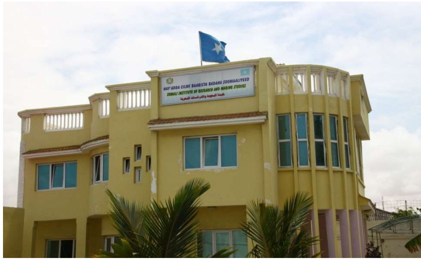
Guriga Hey'addu shaqada ku bilowday ee Deg. Kaaraan

Gurigu wuxuu ka koobnaa 6 (lix) xafiis, hool shir oo dhammaantood loo dhameystiray miisaskii iyo kuraastii oo noocyo kala duwan lahaa.