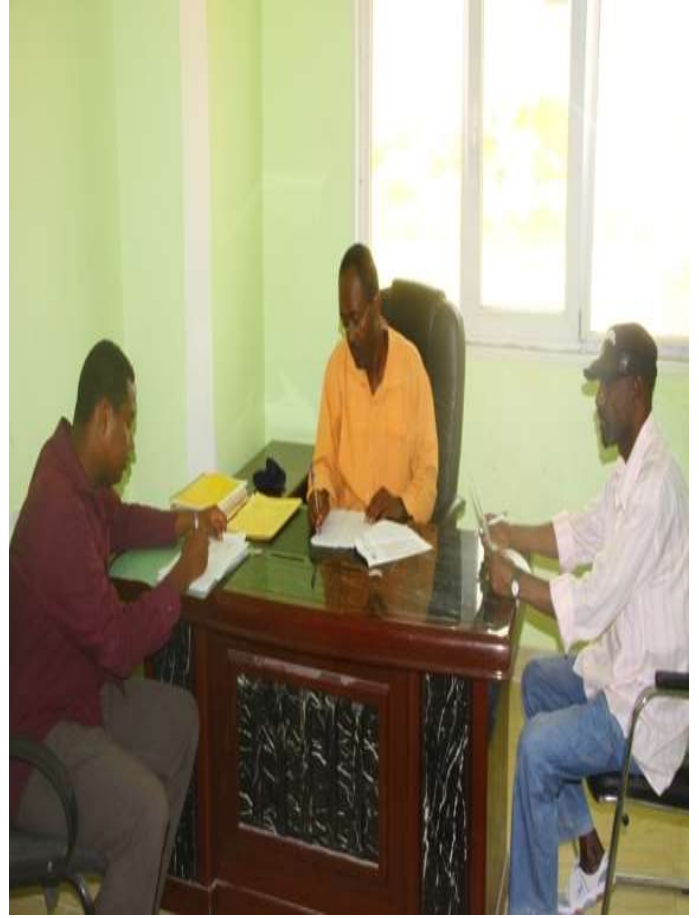
Waaxda Culuunta badda

Waxaa deyn inoogu soo qaaday qeyb alaabta ka mid ah qeybna naga bixiyey:-