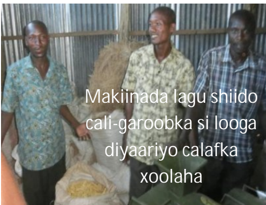
Makiinada lagu shiido cali-garoobka si looga diyaariyo calafka xoolaha

Waxaa sidoo kale laga dhigi karaa geedkan calafka xoolaha ayada oo lagu daraayo caws iyo geeda kale, si loo yareeyo dhibta aw ku keeno markay toos u cunaan, taasoo ah inuu dheefshiidka xiro iyo ilkaha oo ka daadiyo sokorta oo ku badan awgeed.